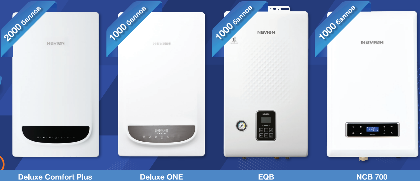
Deluxe Comfort Plus